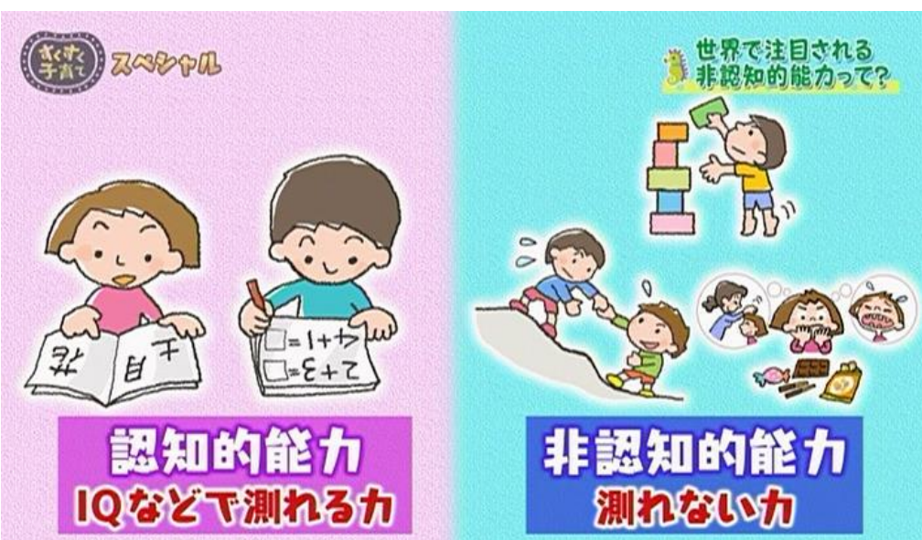
就学前の「非認知能力」